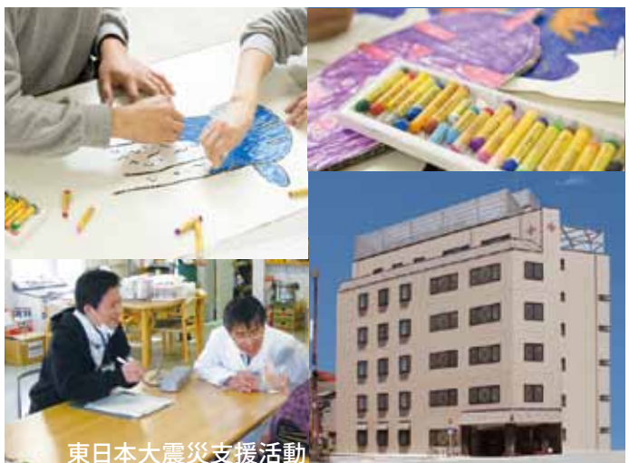
東日本大震災支援活動